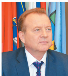
Вячеслав НОВИКОВ, глава администрации Октябрьского района города Барнаула