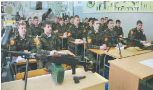
На занятиях по огневой подготовке

К середине 1970-х годов этап становления военной кафедры завершился и начался период её интенсивного развития. С сентября 1975 года в учебный процесс включили 4 цикла: общевойсковой