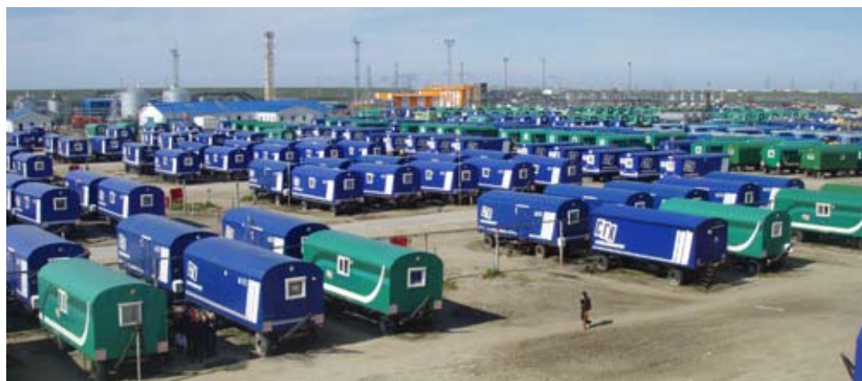
Эти домики стали нашим приютом на целых два месяца