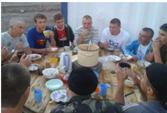
Все, что есть в печи, на стол мечи!

Вот и подошел к концу третий трудовой. Студенческий строительный отряд «Импульс» закончил свой сезон и отправляется в путь. Впереди ждет дом с его уютом и тишиной, а за спиной два незабываемых месяца лета в кругу прекрасных и безумно дорогих людей. Практически все ребята, поехали первый год в ССО, но смогли сплотиться за столь короткий срок, и, конечно же, постарались перенять традиции старичков отряда и придумать что-то новое. Радушный прием ОАО СПП «Стройгаз» и отличные условия расположения приятно удивили наш отряд. Принимающей организацией было сделано всё для того, чтобы студенты хорошо жили и отлично работали.