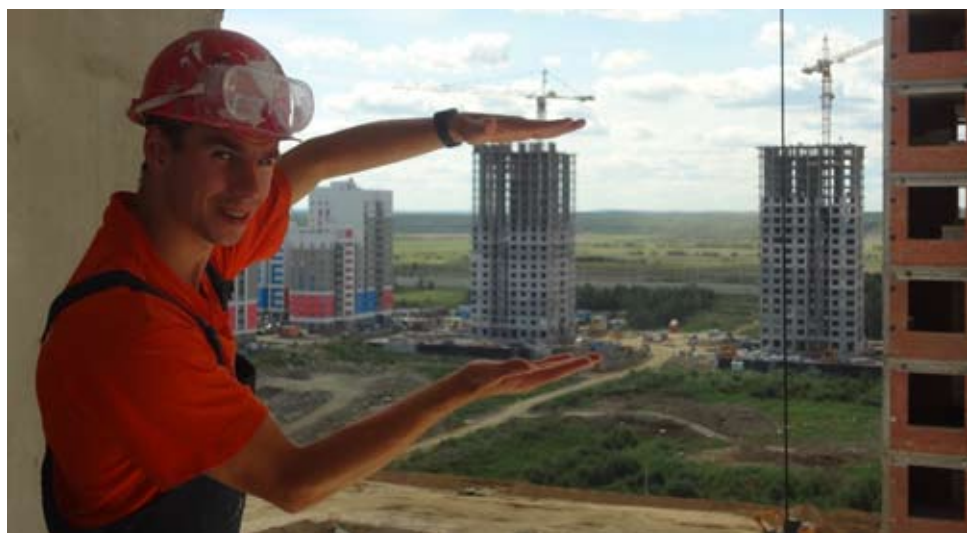
Гарантия качества – наша специальность