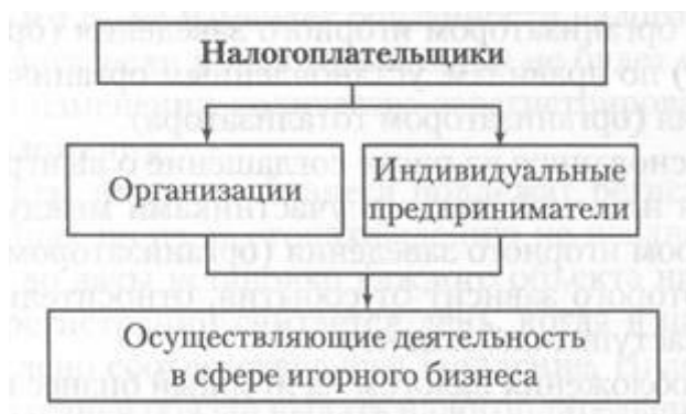
Рисунок 2 – Плательщики налога на игорный бизнес

С 1 июля 2009 года полномочия Федеральной налоговой службы по администрированию игорного бизнеса вне игорных зон прекращаются. До этой даты Федеральная налоговая служба в рамках возложенных на нее полномочий провела подготовительную работу. В частности, собрана информация о количестве игорных заведений, которая в полном объеме и с указанием конкретных адресов осуществления деятельности доведена до МВД России, ФСБ России, Прокуратуры и органов власти субъектов РФ.