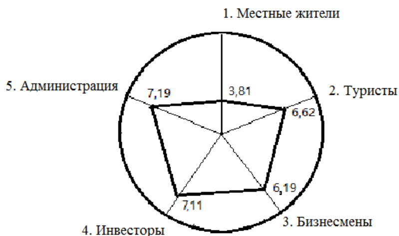
Рисунок 1 – Сводные оценки экспертных групп

На основании полученных данных мы представили оценки экспертных групп по экономическим и управленческим факторам в виде круговых диаграмм, на основании которых был выведен итоговый результат, представленный на рисунке ниже.