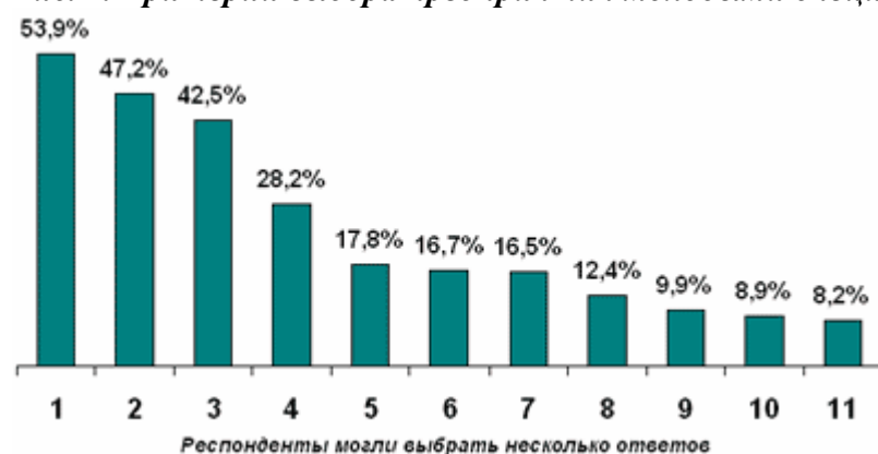
Рис. 2. Критерии выбора предприятия молодыми специалистами