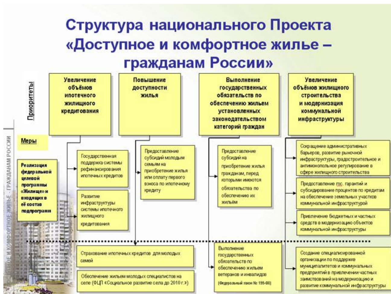
Рисунок 1- Структура национального Проекта «Доступное и комфортное жильё – гражданам России»

Для более эффективного функционирования данного национального проекта необходимо решить следующую систему задач: