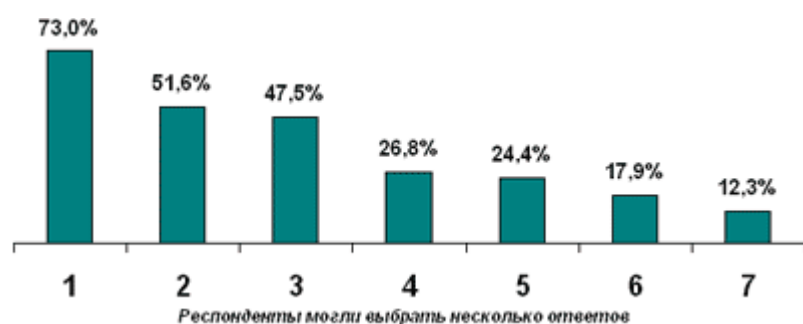
Рис. 1. Критерии выбора молодых специалистов из числа выпускников вузов

Специалисты агентства «РейтОР» выяснили, на основе каких критериев представители обеих групп делают свой выбор. Эти вопросы были изучены в ходе исследования в 23 крупных городах России. Работодатели, как правило, используют три основных критерия при найме на работу молодых специалистов из числа выпускников вузов (см. рис. 1).