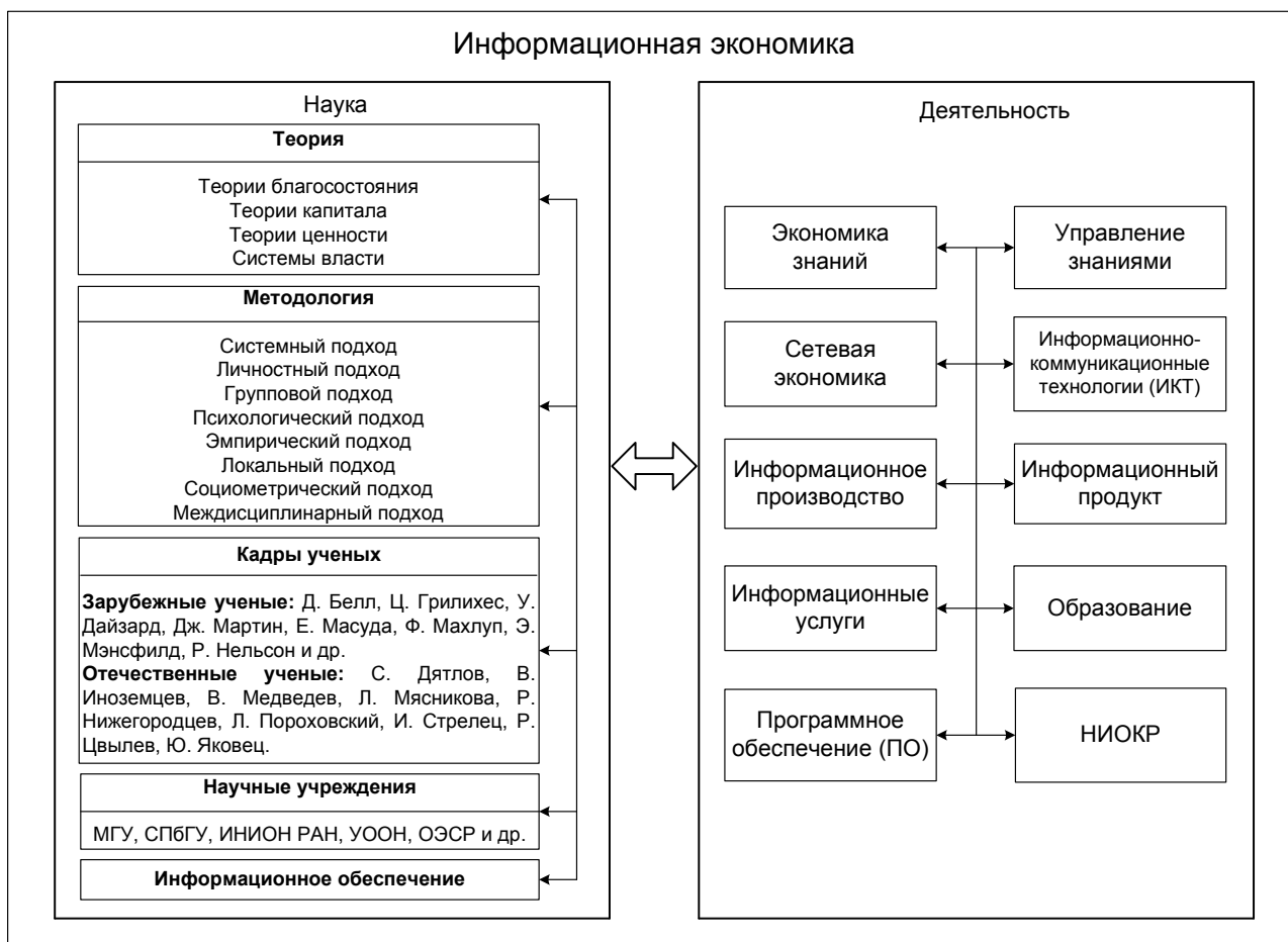
Рисунок 1 – Концептуальная модель современной информационной экономики