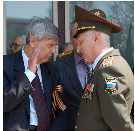
Даже ректор отдает честь офицеру!

– Военным я хотел быть всегда, сколько себя помню. Офицерская форма, погоны, оружие – для меня были символом мужества, мужского начала, поэтому после окончания школы вопрос выбора для меня не стоял. В 1985 году я стал курсантом Ташкентского