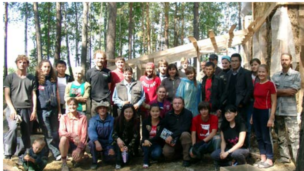
Активисты строительства – студенты и преподаватели АлтГТУ, Монгольского технического университета (г. Улан-Батор), Восточно-Казахстанского государственного технического университета (г. Усть-Каменогорск).