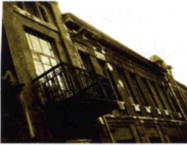
тот самый дом

- И в студийной, и в нестудийной есть свои прелести. Но я предпочитаю нестудийную жизнь. Обожаю фотографировать людей, их эмоции. Вообще, в душе я индеец. Люблю природу, но пока моя техника не позволяет снимать её так, как хотелось бы. Поэтому большая часть моих работ посвящена людям.