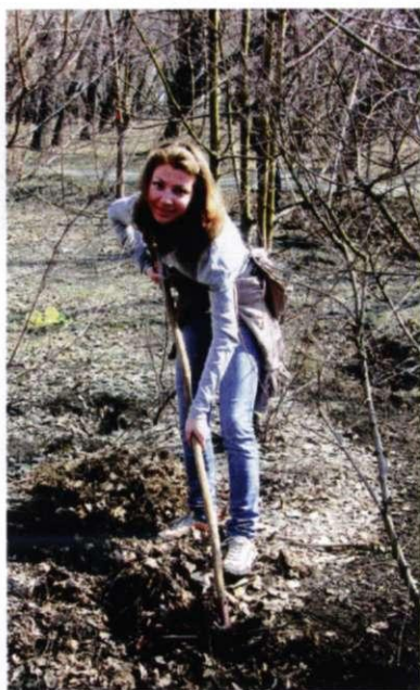
Сегодня грабли - лучший друг!

Но, как известно, весна – пора субботников. Многие люди только при одном упоминании «субботника» морщатся, одновременно придумывая разных врачей, неубранную из подвала картошку (какую картошку!?), в общем, повод, по которому «ну никак не получится прийти на уборку». Но, судя по результатам субботника, студенты нашего университета относятся к другой, меньшей части людей. Приятно, очень приятно, и это действительно правда: «политехники»