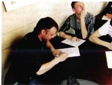
Интеллектуалы в процессе

Напомним, что интеллектуальный студенческий клуб «Artis» существует с ноября 2006 года. На занятиях ребята ведут дебаты, проверяют свои интуицию, логику, скорость и масштаб знаний в командных соревнованиях, проводимых в форме игр «Что? Где? Когда?» и «Своя игра».