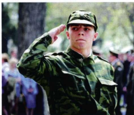
Воспитанник военной кафедры АлтГТУ

Жди меня, и я вернусь. Только очень жди, Жди, когда наведут грусть Желтые дожди, Жди, когда снега метут, Жди, когда жара, Жди, когда других не ждут, Позабыв вчера. Жди, когда из дальних мест Писем не придет, Жди, когда уж надоест Всем, кто вместе ждет. Жди меня, и я вернусь, Не желай добра Всем, кто знает наизусть, Что забыть пора. Пусть поверят сын и мать В то, что нет меня,