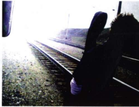
Моя первая фотография

Любимые фотографии: Луис Кастаньеда, Питер Берд, Ги Бурдан, Вальтер Бродбек