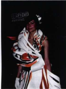
Студентка ИнАрхДиза в новом платье

Весь апрель в выставочном зале Союза художников работала выставка Института Архитектуры и Дизайна (ИнАрхДиз «PRO БУДУЩЕЕ», приуроченная к 20-летию создания кафедры архитектуры и показала посетителям перспективы дальнейшего развития архитектурного и дизайн-образования в Алтайском крае.