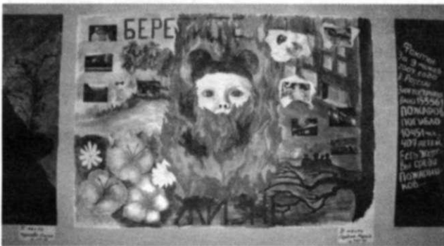
Конкурс плакатов - «Пожарная безопасность»