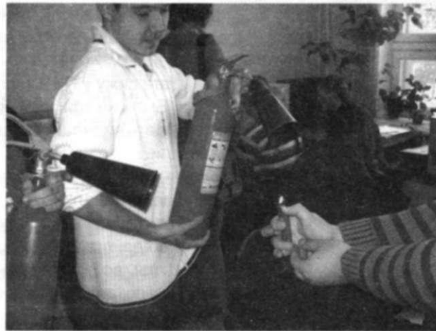
Спички- детям не игрушки!

А еще важно уметь взаимодействовать со специальными службами. Для этого в Вузах время от времени проводят учения. Нашу Alma Mater Управление государ-