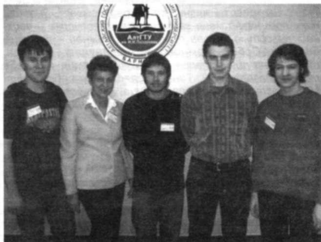
Победители с тренерами

Как известно, ФИПИ – самый «компьютерный» факультет нашего Университета. Именно поэтому студенты этого факультета ежегодно принимают участие в Международной Олимпиаде по программированию. И вот ноябрь 2007 не стал исключением. По традиции здесь собрались одаренные программисты не только из России, но и из-за рубежа. В этих соревнованиях можно проверить себя, посмотреть, на что способны окружающие и, разумеется, даже, наверное, в первую очередь, побороться за право участия в ФИНАЛЕ!