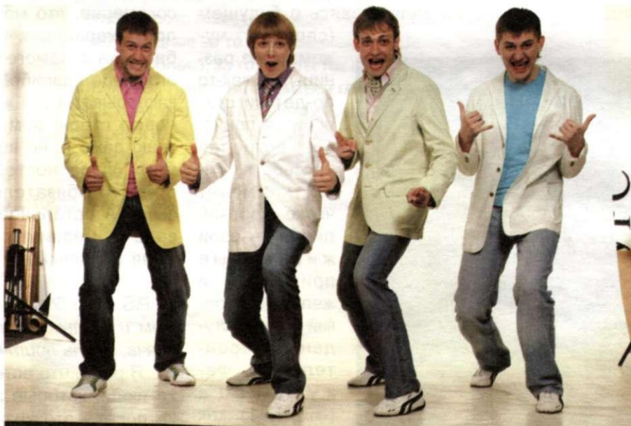
Команда КВН «Совместный проект»