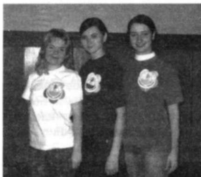
«Мы тушканчики - атак, мы порвем вас всех за раз!»

Когда ребята собирались на школу актива, то многие даже не знали, что им предстоит! А их ожидал активнейший день! Для начала нужно было познакомиться со своими командами, придумать название и девиз. Конечно, и тут не обошлось без творческого подхода каждого. Чего стоят названия и девизы: - «Бешеные тушканчики» - «Мы туш-