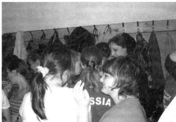
В спортивных раздевалках плотность населения гораздо выше средней по России

И, все-таки, не смотря на все эти проблемы, мы рады, что наше руководство заботится о нашем здоровье. Но такая забота должна проявляться не только формально, но и фактически. Тогда студенты будут получать лишь положительные эмоции и физическое здоровье от занятий ФВС. Надеемся, что ситуация изменится к лучшему, так как это только начальный этап преобразований в области спорта нашего ВУЗа.