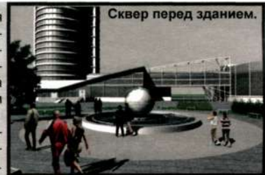
Сквер перед зданием.

Главной идеей проектирования комплекса было создание свободного и разнообразного пространства.