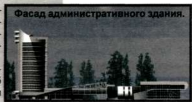
Фасад административного здания.