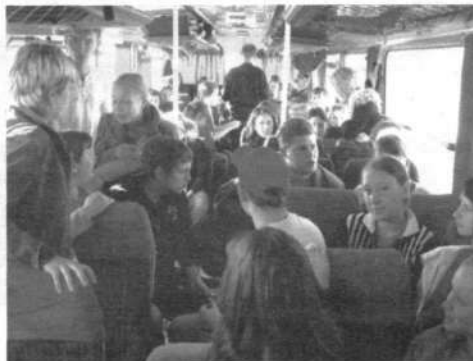
На пути в Новосибирск: тесно, но весело!

жимало. Взглянув на часы и поняв, что театр им. Гоголя, где планировалась игра КВН, был далеко, мы на максимальной скорости, с которой могли бежать девчонки, рванули туда.