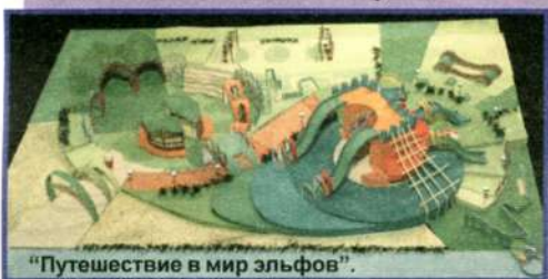
"Путешествие в мир эльфов".