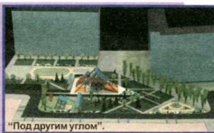
"Под другим углом".