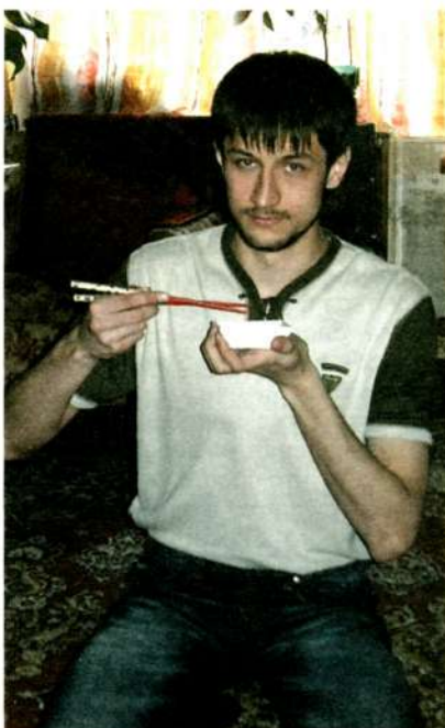
Всё в восточной культуре притягательно – языки, философия и кухня!

- Трудно, честно скажу. Но у меня получается. Сейчас я учусь на фа-