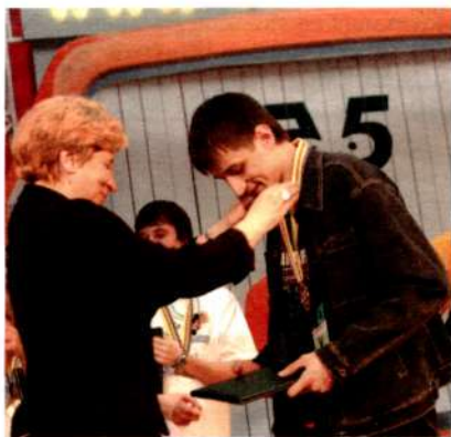
Золотая медаль нашла своего героя.

-Я стараюсь расставить свои занятия в соответствии со степенью важности. Что-то для меня важнее