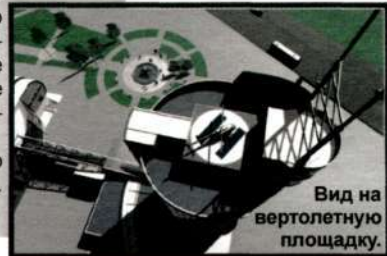
Вид на вертолетную площадку.