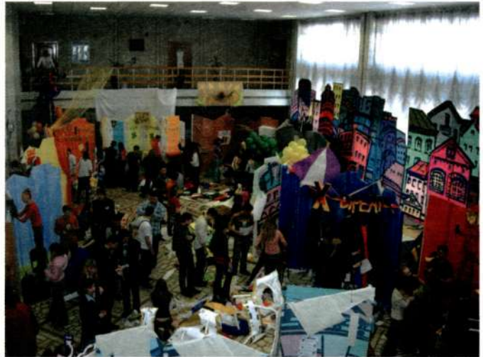
Творческий процесс конкурса в разгаре.

- Я считаю, для того, чтобы добиться чего-либо в жизни, нужно иметь чёткий план. И не только. Ведь можно хотеть иметь классную работу, а можно искать эту работу всеми силами. Поэтому важно не