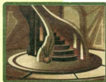
Лестница в холле.