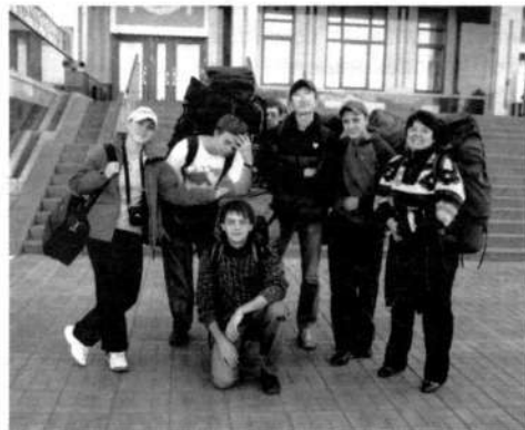
Команда профессиональных туристов Политеха