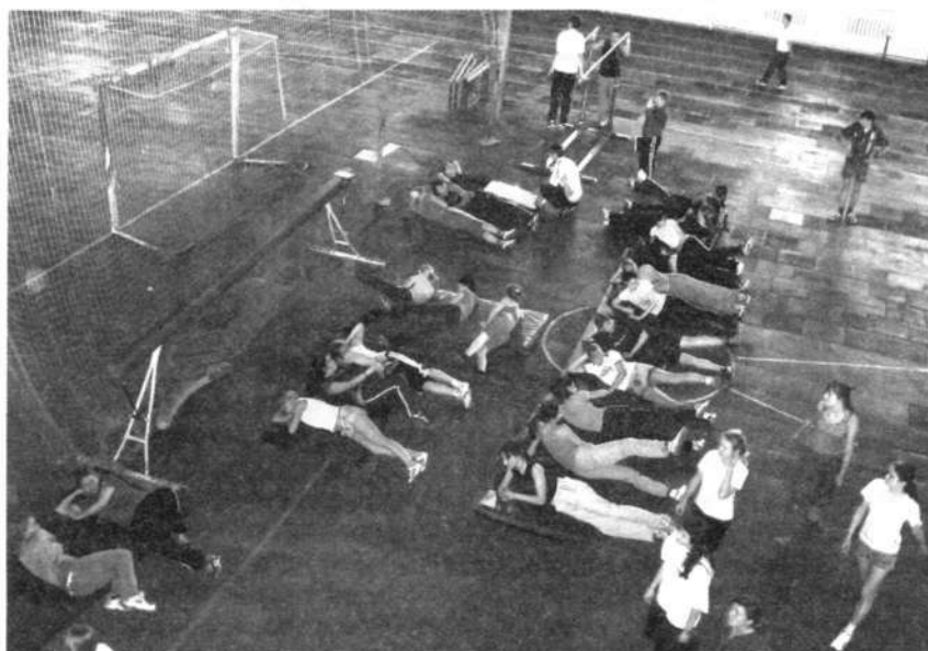
Жесткая конкуренция за место на матах.

Здоровье - это, конечно, хорошо. Особо радует тот факт, что именно в нашем ВУЗе ввели ФВС до 4 курса. Но, так ли все гладко, как это кажется на первый взгляд?