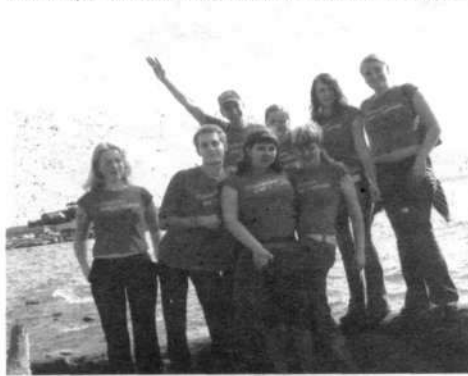
Группа поддержки АлтГТУ на берегу Обского моря.

Разделившись на несколько групп, мы решили сами нарисовать карту данного городка. Помимо кафе, метро и парка аттракционов мы посетили зоопарк.