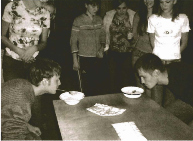
Конкурс: «Кто сильнее»