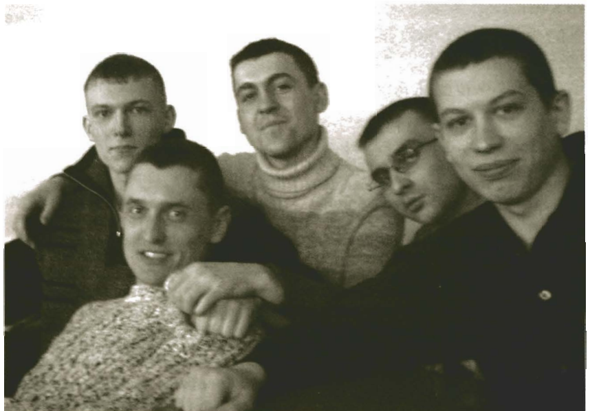
Студенты специальности КИРС, 5 курс.