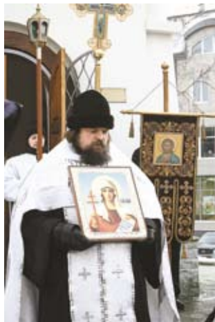
Благослови, святая великомученица.