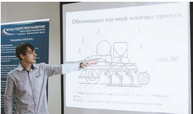
Защита проекта на заседании экспертного совета программы «У.М.Н.И.К.».

и внедрением новых разработок в инновационной сфере, области электроники, энергосберегающей техники, машиностроительного и пищевого оборудования. Так, ученые кафедры сельскохозяйственного разработали уникальную технику для превращения песка пустынь в плодородные земли.