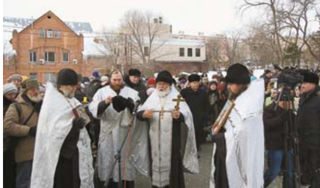
Молебен в честь С. Татианы.

узнать о житии святой Татианы, Православной Церкви, Барнаульская духовная семинария, Алтайский государственный технический университет им. И. И. Ползунова при поддержке комитета по делам молодежи администрации города Барнаула.