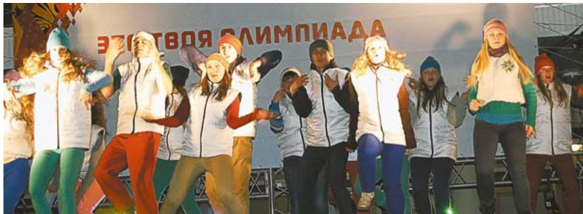
Политехники приветствуют Эстафету Олимпийского огня.

На сегодняшний день наш вуз является лидером среди вузов Алтайского края по реализации инновационной работы. С каждым годом растет количество малых инновационных предприятий, на сегодняшний день, их более 30. Наши ученые активно заняты проведением научных исследований